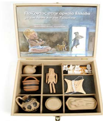
Εικόνα 5 : Παίζοντας στην αρχαία Ελλάδα

Η Μουσειοσκευή «Παίζοντας στη αρχαία Ελλάδα» παρέχει στο μαθητή την ευκαιρία να μάθει τις ρίζες και την προέλευση των παιχνιδιών.