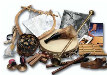
Εικόνα 6: Μουσικά όργανα στην αρχαία Ελλάδα

χέρια του ανακατασκευές αρχαίων μουσικών και να ακούσει παραδείγματα αρχαίας ελληνικής μουσικής.