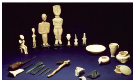
Εικόνα 4: Κυκλαδικός Πολιτισμός

Η Μουσειοσκευή «Κυκλαδικός Πολιτισμός» παρέχει τη δυνατότητα στο μαθητή να γνωρίσει τον πολιτισμό που αναπτύχθηκε στις Κυκλάδες την 3 η π. Χ. χιλιετία.