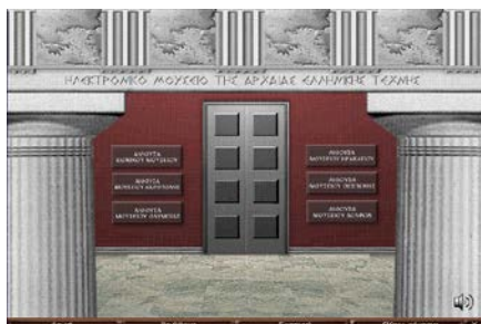
Εικόνα 1: Βασικό περιβάλλον του λογισμικού «Αρχαιομανία»

Επιλέξτε «Αίθουσα Μουσείου Δελφών», επισκεφτείτε τις αίθουσες και θαυμάστε τα εκθέματα.