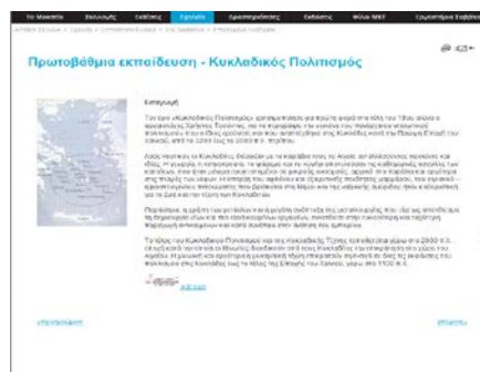
Εικόνα 3: Το Μουσείο της Κυκλαδικού Τέχνης

Το διαδίκτυο σας δίνει την δυνατότητα της εικονικής περιήγησης στους χώρους του Μουσείου.